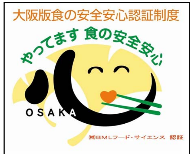
認証マーク(ステッカー)